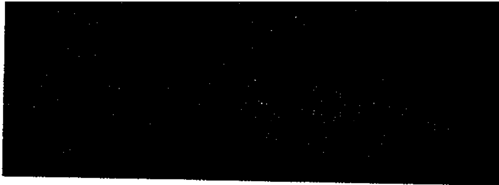
حقول الأرز في الهفوف

لم تكن محاربة الأتراك خبرة جديدة بالنسبة إلى ابن سعود، ذلك أنه كان قد لاقى، مرة بعد أخرى، فصائل تركية، وبخاصة مدفعية الميدان، ضمن جيوش ابن الرشيد، ولكن الهجوم على الأحساء، التي كان يحكمها الأتراك مباشرة، كان شيئاً آخر مختلفاً تماماً، ذلك أنه يجعله يصطدم بدولة عظمى وجهاً لوجه. ولكن ابن سعود لم يكن باستطاعته أن يختار، فما لم يخضع الإحساء وميناءها لسيطرته فإنه يبقى معزولاً عن العالم الخارجي دائماً، وغير قادر على أن يحصل على ما كان في أمس الحاجة إليه من الأسلحة والذخائر وكثير من ضروريات الحياة. كانت الغاية تبرر المغامرة، ولكن الخطر كان كبيراً جداً، حتى أن ابن سعود تردد طويلاً قبل أن يقوم بأي هجوم على الأحساء وعاصمتها، الهفوف. وهو لا يزال مولعاً، حتى الآن بأن يروي الظروف التي اتخذ فيها قراره النهائي.