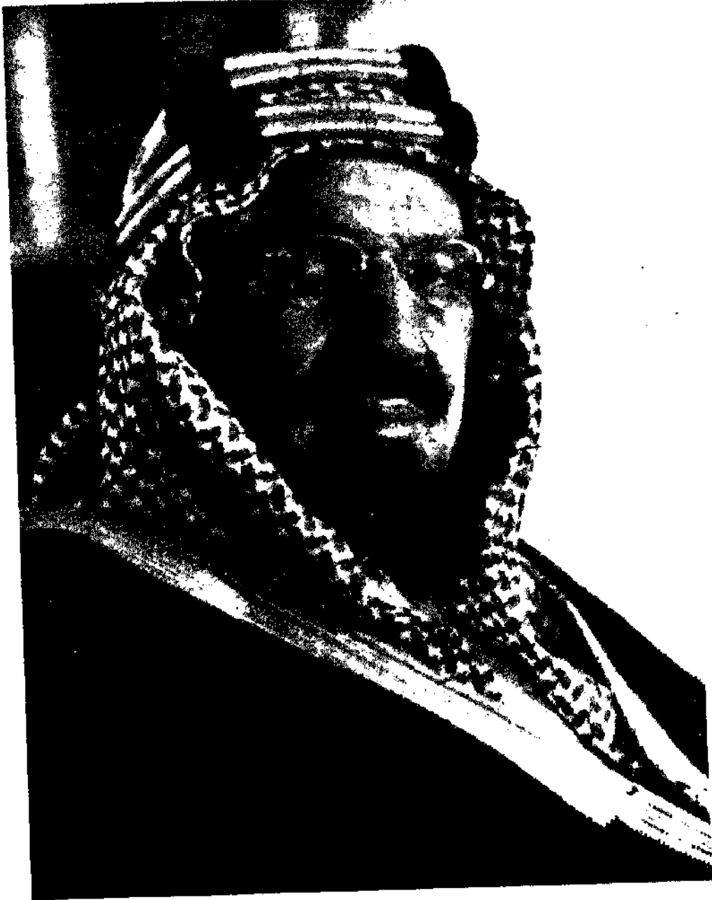
الملك عبد العزيز، تغمده الله برحمته